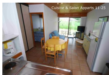
Cuisine & Salon Apparts 11-25