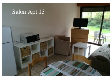
Salon Apt 13

☒ Lave-linge & sèche-linge (tarifs & horaires à la réception) ☒ Vaisselle supplémentaire sur demande ☒ Jeux de Société