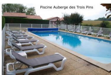
Piscine Auberge des Trois Pins