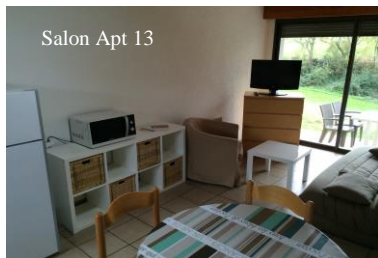
Salon Apt 13

☒ Lave-linge & sèche-linge (tarifs & horaires à la réception) ☒ Vaisselle supplémentaire sur demande ☒ Jeux de Société