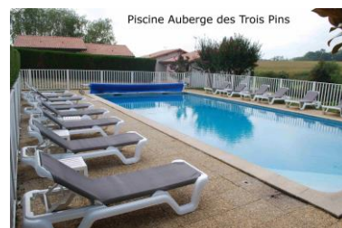
Piscine Auberge des Trois Pins