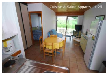
Cuisine & Salon Apparts 11-25